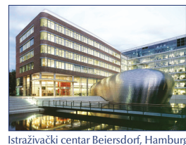
Istraživački centar Beiersdorf, Hamburg

Linija proizvoda Eucerin® Zaštita od sunca prati najviše dermatološke standarde kako bi se osigurala vrhunska kvaliteta: upotrebljavamo samo odabrane aktivne sastojke koji su pažljivo istraženi. Njihova učinkovitost i podnošljivost dokazane su u objektivnim kliničkim i dermatološkim istraživanjima.