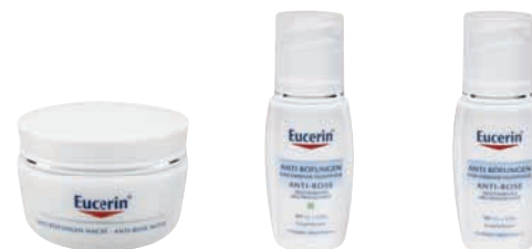
INTENZIVNA NOĆNA KREMA